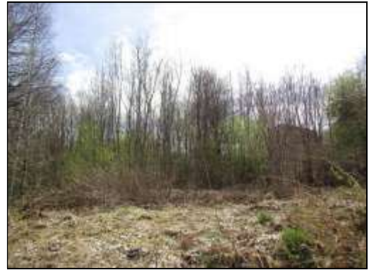
Skats uz zemes vienības ZR daļu