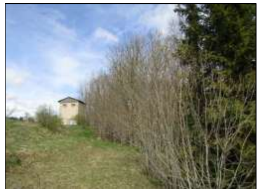
Skats uz zemes vienības DR daļu