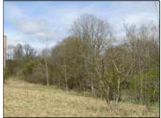
Skats uz zemes vienības DA daļu