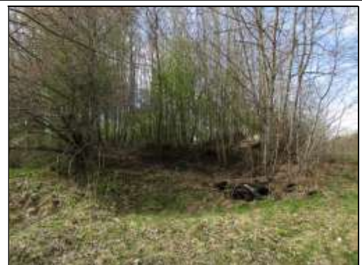
Skats uz zemes vienības Z daļu