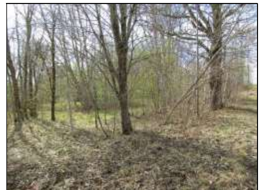
Skats uz zemes vienības ZA daļu